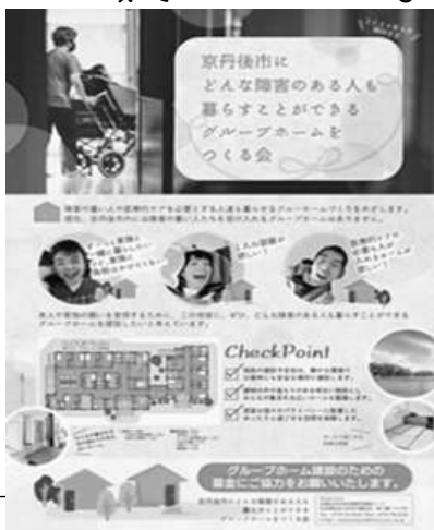
新聞折込に入れたチラシ

現在、目標の6,600万円に対して、4,365万円(66%)の到達となりました。残り9か月でやりきらなければなりません。 (次回は最終原稿「いつの時代も地域とともに」)